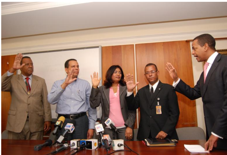
Acto de Juramentación Comité de Licitaciones

En el mes de julio 2008, se instaló en la Cámara de Diputados un sistema de compras y contrataciones de bienes y servicios. Dicho sistema, diseñado con la asesoría técnica del Grupo Gestión Moderna, está integrado por un Comité de Licitaciones y otro Comité de Compras como órganos sustantivos del mismo. El sistema se rige por unos procedimientos claramente definidos, cuya base de sustento se encuentra en la Ley 340-06 sobre Compras y Contrataciones de Bienes, Servicios, Obras y Concesiones, sus modificaciones contenidas en la Ley 449-06 y el Reglamento de Aplicación 490-07. Hoy día, todas las compras y contrataciones en la institución son gestionadas mediante la rigurosa aplicación de esos procedimientos.